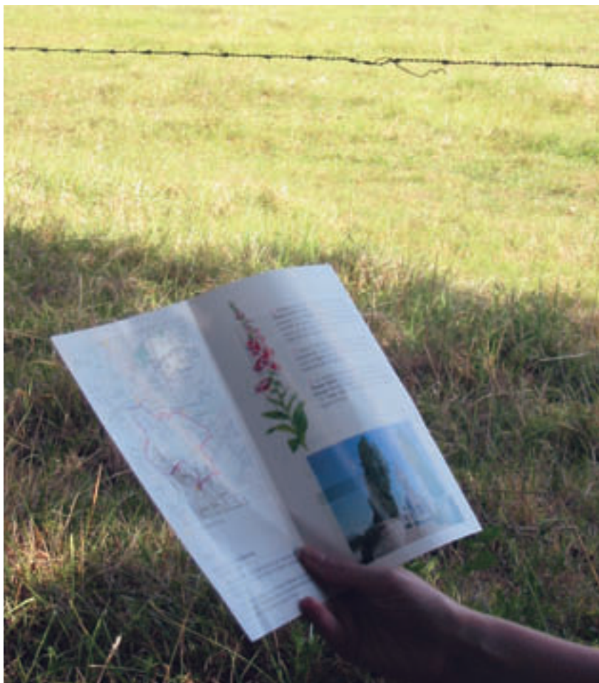
Les livrets d'information sont des outils intéressants pour orienter la fréquentation dans les espaces protégés. En attendant la généralisation des guides numériques...

des opportunités de valorisation des produits touristiques des professionnels partenaires, tout en tenant compte de la nécessaire protection de la ressource environnementale.