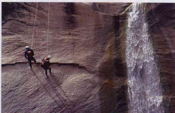
HORS PISTE BIEN BALISÉE. Corsica Raid et via ferrata des Vigneaux (Hautes-Alpes), la première qui s'est vu installer un péage.